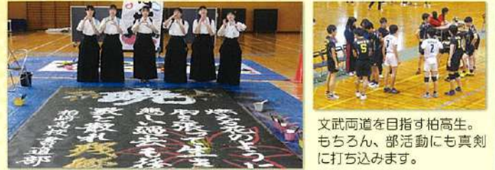
文武両道を目指す柏高生。もちろん、部活動にも真剣に打ち込みます。