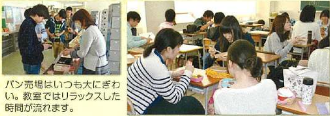
パン売場はいつも大にぎわい。教室ではリラックスした時間が流れます。