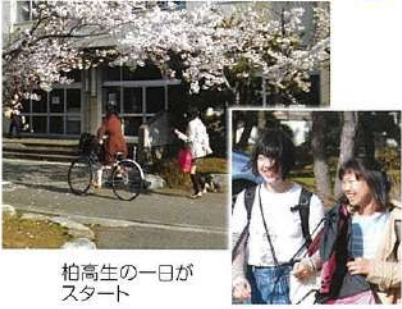
柏高生の一日常がスタート