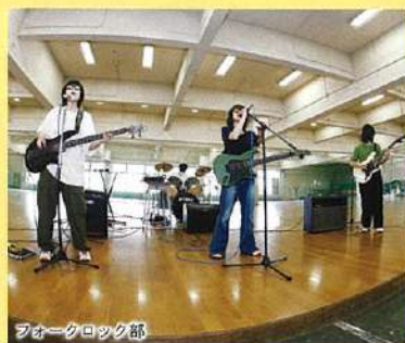
フォークロック部