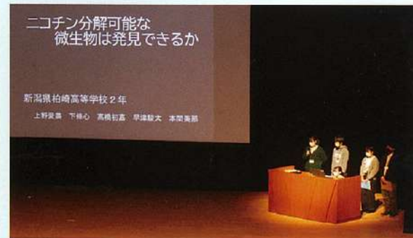
SSH課題研究発表会の様子 ~柏崎市文化会館アルフォーレ~