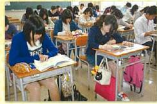
10分ですが集中しています。