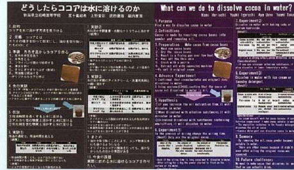
課題研究発表会での英語ポスター