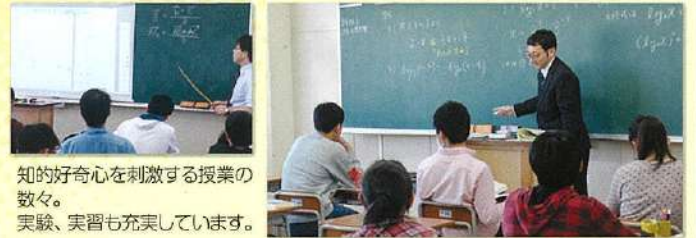
知的好奇心を刺激する授業の数々。実験、実習も充実しています。