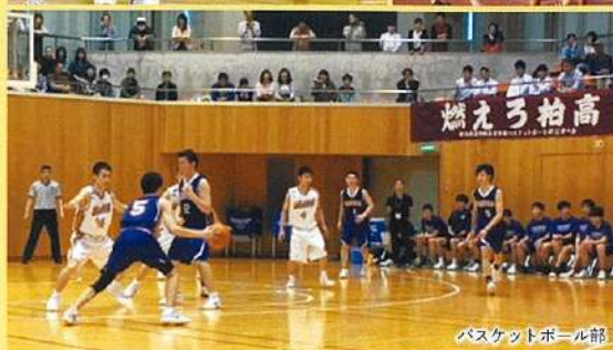
バスケットボール部